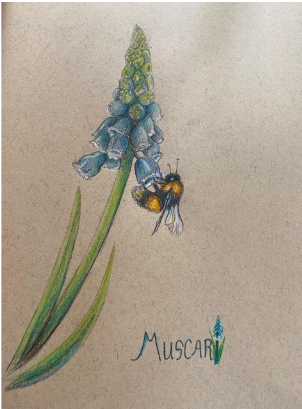
Het blauwe druifje

Tekenaar: Ada Besselink - Prunuslaan 11 - Autodidact