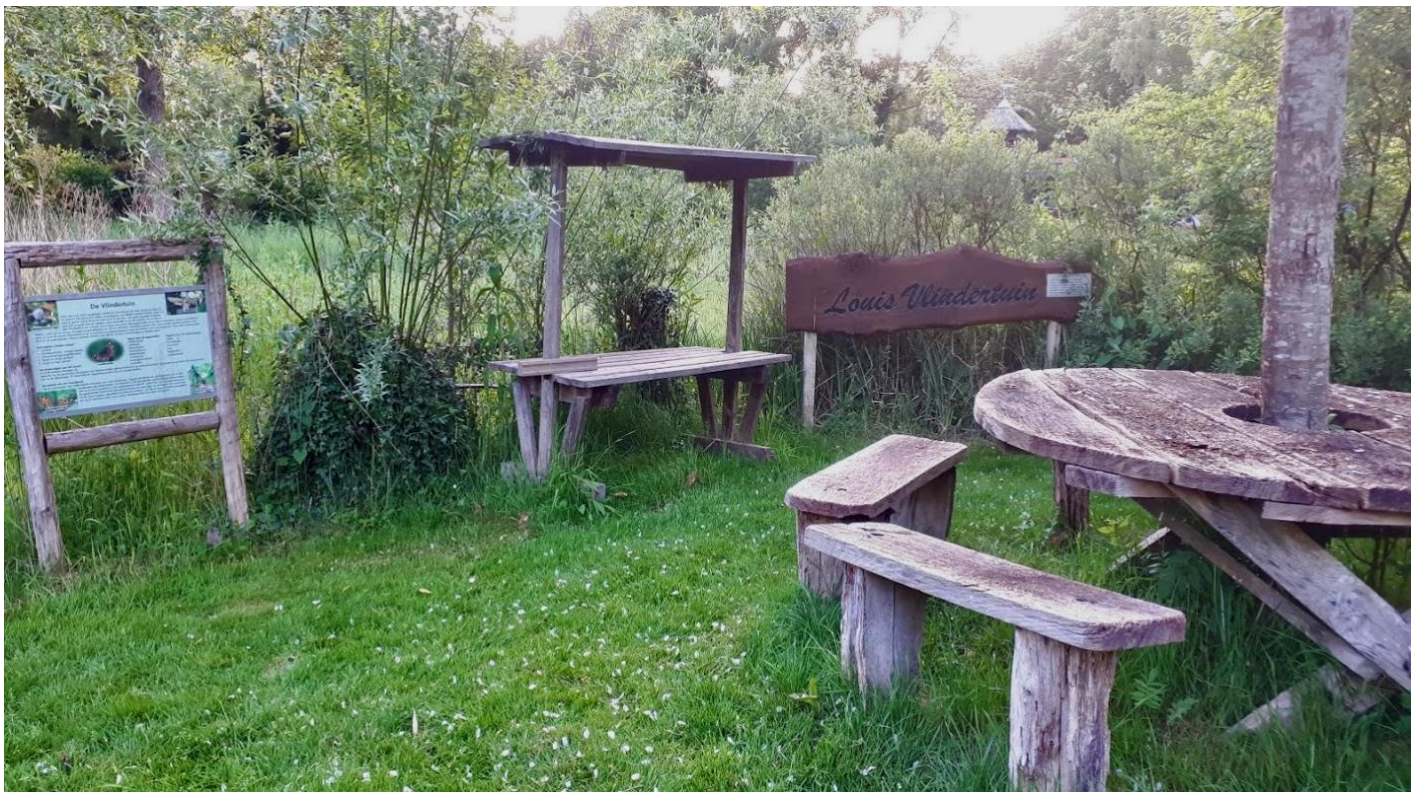
Louis Vlindertuin