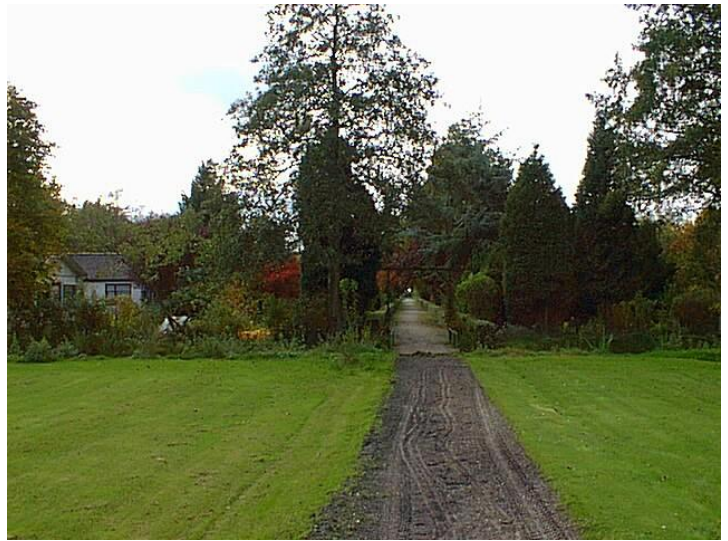
Het gebied voordat het de Vlindertuin werd

De grond die vrijkwam door het graven van het stukje moeras dat naast de vlindertuin ligt, vormt de rug waar de vlindertrekkende bloemen zijn geplant. Als je goed kijkt, zie je hier overgangen tussen verschillende milieus, zoals nat en droog, hoog en laag, verruigd en gecultiveerd, zon en schaduw. Daardoor kunnen hier veel soorten planten groeien. Nectarplanten, maar ook waardplanten als brandnetel en judaspenning voor rupsen en voor vlinders om hun eitjes op af te zetten.