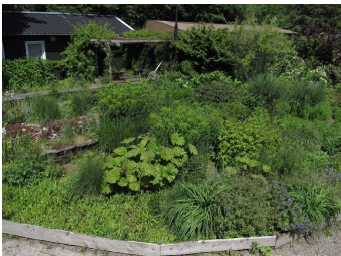
Siertuin Stadsparkingang 2012