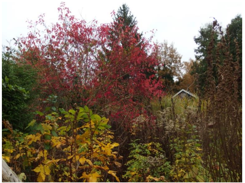
Siertuin Stadsparkingang Kardinaalsmuts

Het stapelmuurtje elk jaar even bijwerken.